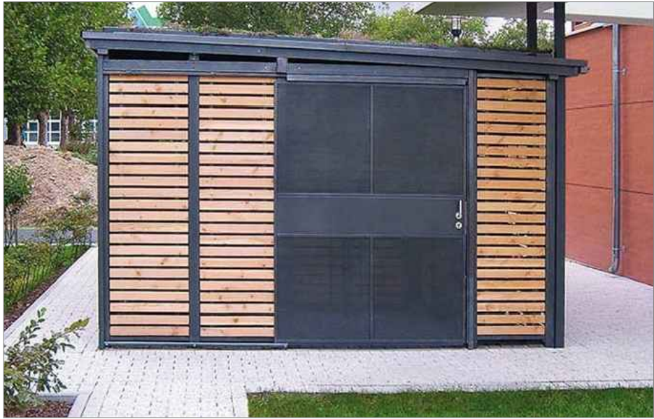
REFERENČNÉ FOTO - zdroj Gerhardt Braun (použiť porovnateľné)